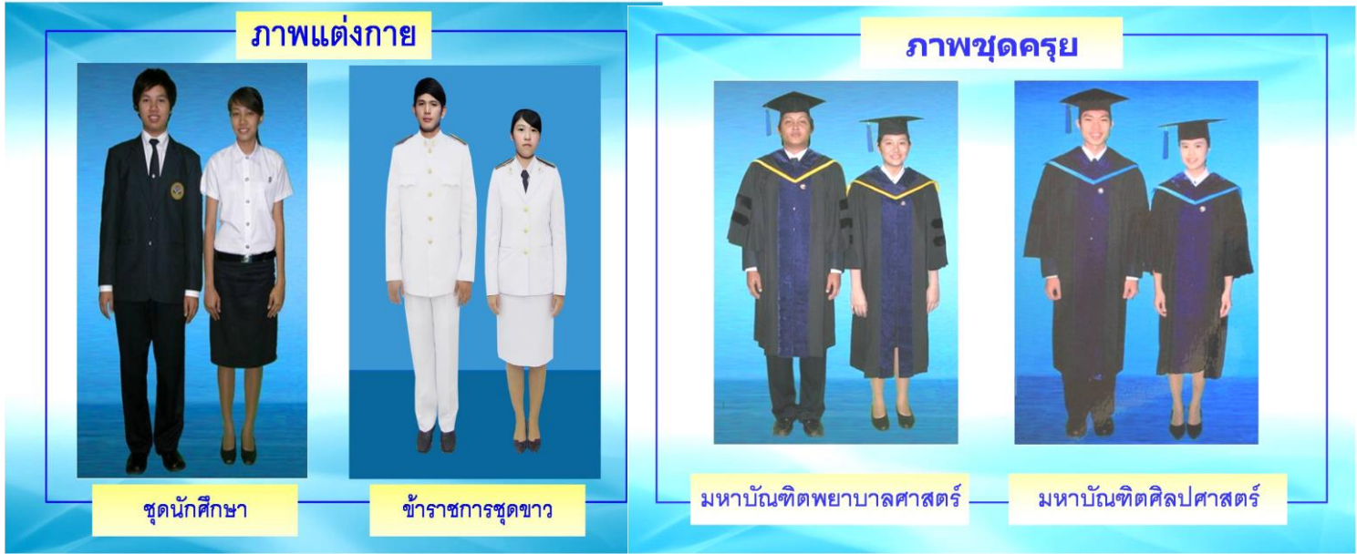
ชุดนักศึกษา